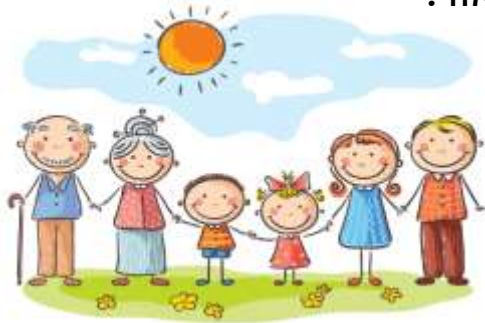
כל הזכויות שמורות למזי ג'ורנו

לכבוד יום המשפחה נסענו, כל המשפחה ביחד, לטיול בצפון הארץ. בדרך ראינו פרות/ פרות וכבשים. כשהגענו לימת הכנרת, קפצנו ישר למים בבגדי הים החדשים שלנו. היה חם/ חום מאוד. סבא וסבתא הכינו לנו מטעמים, וכשיצאנו מהמים אכלנו הכל בהנאה רבה. סבא ספר לנו שלפני הרבה מאוד שנים/ שנים, הוא וסבתא נפגשו בפעם הראשונה בכנרת. סבתא הייתה אז אשה יפה/ יפה מאוד, והוא מיד נגש לשוחח איתה. כשסיימנו לאכול, אבא שחק אתנו בכדור/ בכדור. חזרנו הביתה נרגשים ועיפים מאוד.