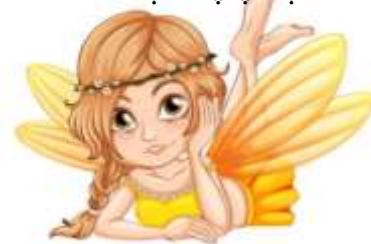
כל הזכויות שמורות למזי ג'ורנו

בלילה, לפני השנה, אמא של גל מספרת לה ספור על פיה קסומה. פיה שמגשימה משאלות. לפיה יש חקים/ חוקים משלה. כדי שהמשאלה תתגשם, יש לבצע את כל השלבים/ השלבים הבאים: 1. לעצם עינים, לקחת נשימה עמקה דרך/ דרך האף, ולנשף מהפה. 2. לחשב מחשבה טובה, מחשבה מתוקה שמעלה חיוך/ חיוך על הפנים. למשל, על חד-קרן שמשפריץ מים בברכה או על חבוק של אמא. 3. לבקש בשקט בלב את המשאלה, לומר לפיה תודה על ההקשבה, ולהרדם עם חיוך על הפנים/ הפנים. בכל בקר, כשגל קמה, היא שמחה ומחכה שהמשאלה הקסומה שלה תתגשם. לפעמים היא מתגשמת באותו יום/ יום, ולפעמים רק אחרי כמה ימים.