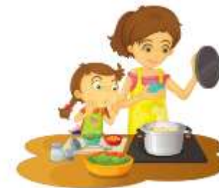
כל הזכויות שמורות למזי ג'ורנו

אני אוהבת מאוד לעזר לאמא לבשל. בימי ששי בצהרים אמא ואני מבשלות/ מבשלים מאכלים לערב שבת. התפקיד שלי הוא לערבב את הסלטים ולהכין עם אמא קנוחים. הקנוח האהוב עלי הוא עוגת קצפת עם עוגיות/ עוגיות. בזמן הבשול אני ואמא מדברות/ מדברים. אני מספרת לה על החברות שלי בבית הספר, והיא מספרת לי על החברים שלה בעבודה. כשהעוגה/ כשהעוגה מוכנה, אנחנו פורסות/ פורסים אותה וטועמות לפני כן, רק כדי לוודא שהיא מספיק מתוקה. 😊